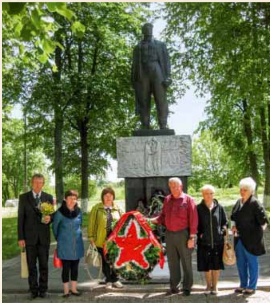
ПОТОМКИ ПАРТИЗАН ИЗ ОТРЯДА «СЛАВНЫЙ»