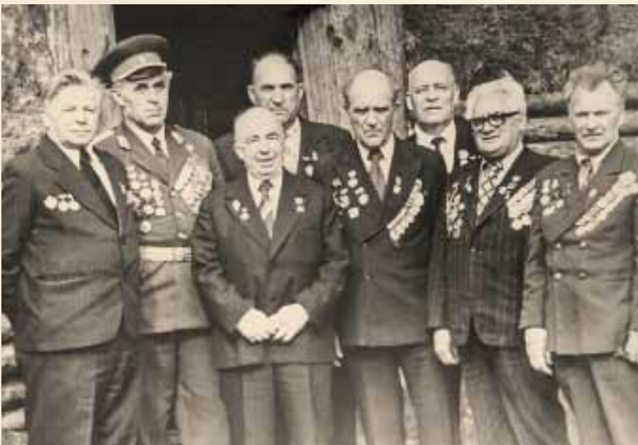
ВСТРЕЧА ШЕСТАКОВЦЕВ В МОСКВЕ, 1975 ГОД

Сообща партизанам все-таки удалось прорвать кольцо окружения. Вместе с ними ушли и местные жители. «Колонна выстроилась до десяти километров... С первых же минут движения стали освобождаться от груза: сбрасы-