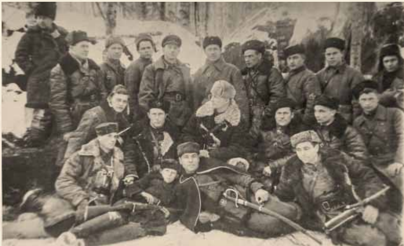
ПАРТИЗАНСКИЙ ОТРЯД «СЛАВНЫЙ»